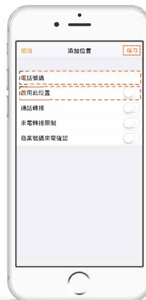
於「電話號碼」中重新輸入你的 手提電話號碼並將「啟用此 位置」設置為「開」