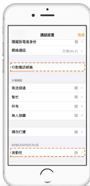
輸入手提電話號碼