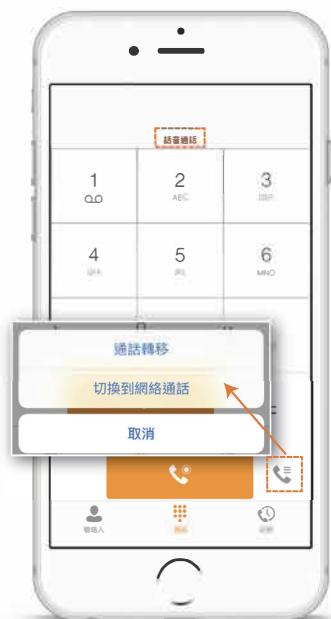
話音通話模式+流動性 (建議作為日常使用)